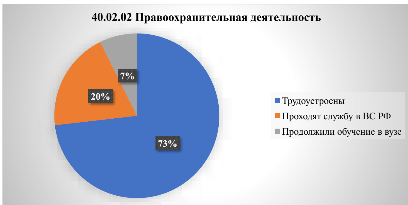
Рисунок 7 – Показатели дальнейшей деятельности выпускников 2022-2023 уч. г. специальности 40.02.02

Среди выпускников специальности 40.02.01 Право и организация социального обеспечения 84% человек трудоустроены.