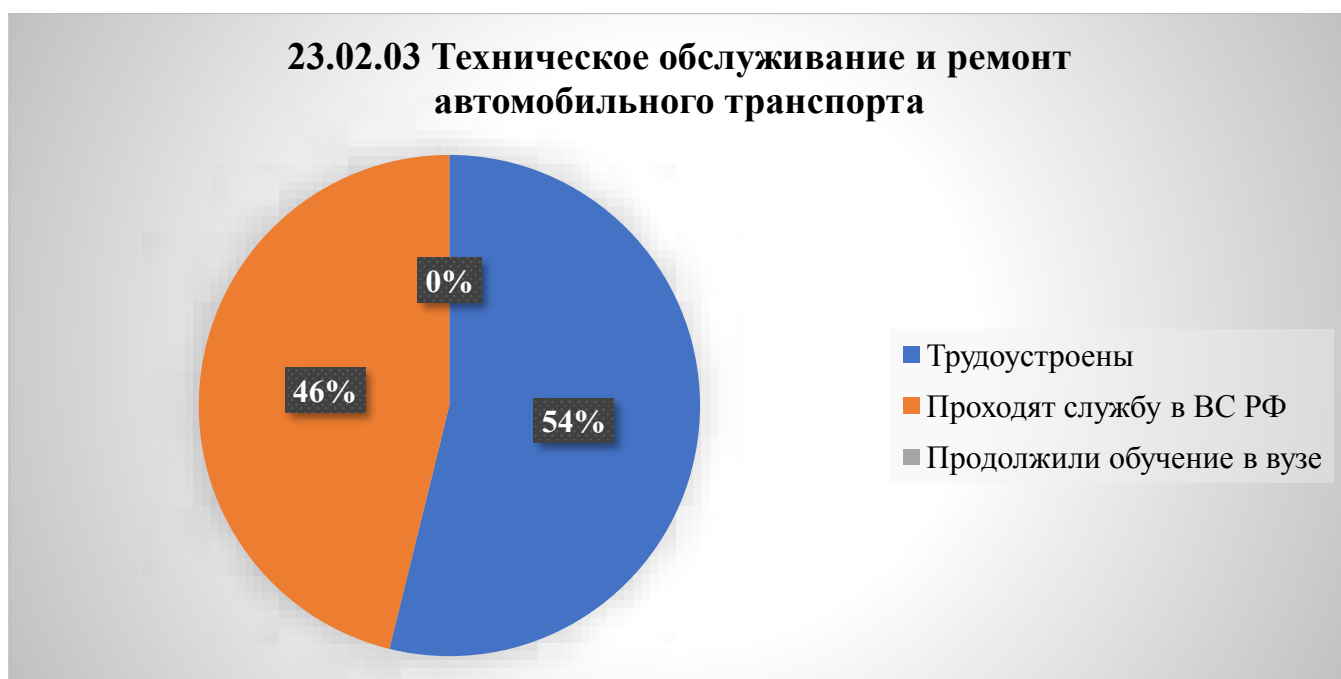
Рисунок 5 – Показатели дальнейшей деятельности выпускников 2022-2023 уч. г. специальности 23.02.03

Среди выпускников специальности 21.02.05 Земельно-имущественные отношения 85% человек трудоустроены.