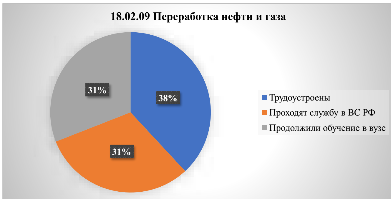
Рисунок 2 – Показатели дальнейшей деятельности выпускников 2022-2023 уч. г. специальности 18.02.09

Среди выпускников специальности 09.02.03 Программирование в компьютерных сетях 53% человек трудоустроены.