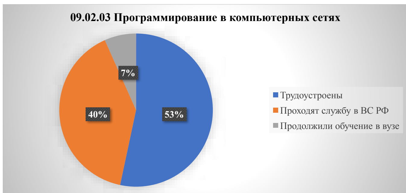
Рисунок 1 – Показатели дальнейшей деятельности выпускников 2022-2023 уч. г. специальности 09.02.03

Рассмотрим эти показатели в графическом виде в разрезе каждой специальности.