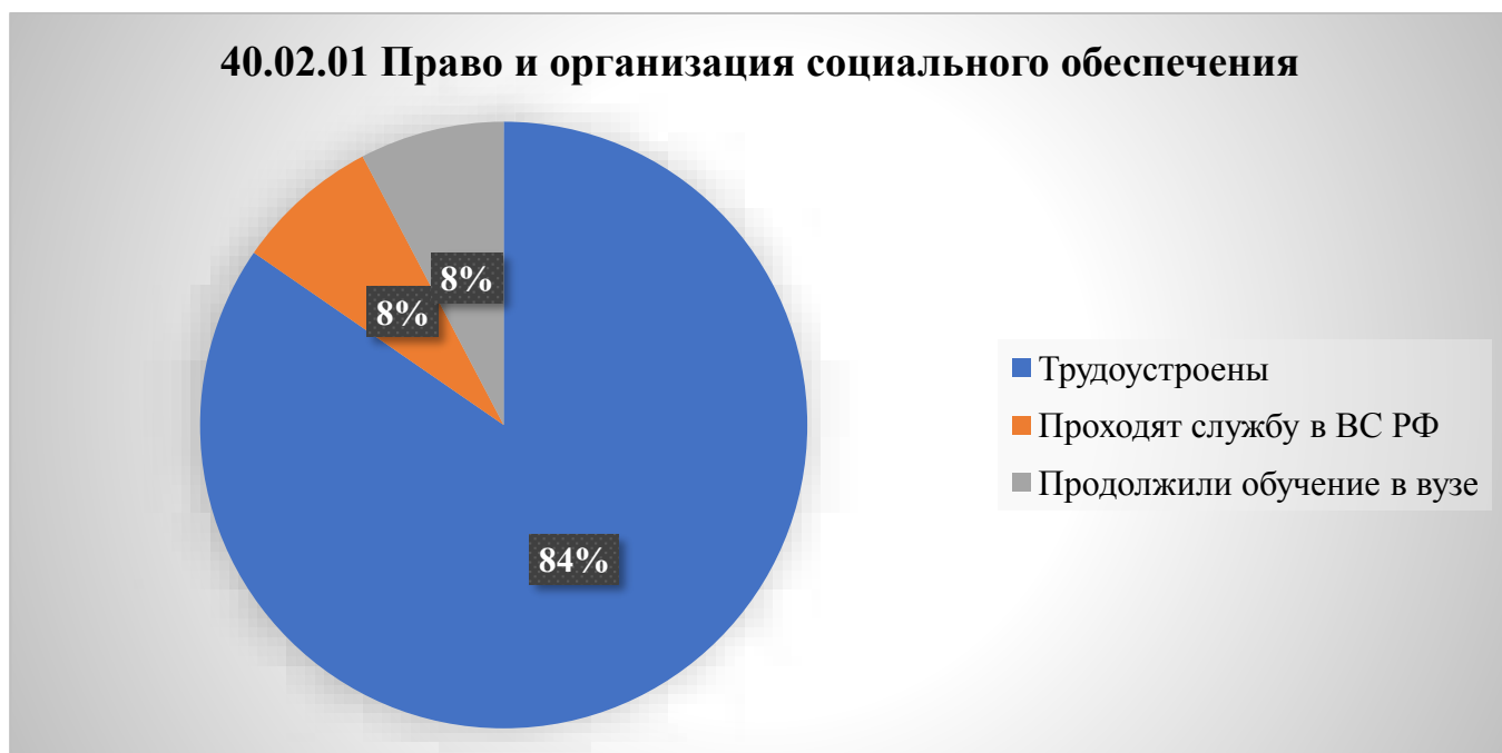
Рисунок 6 – Показатели дальнейшей деятельности выпускников 2022-2023 уч. г. специальности 40.02.01

Среди выпускников специальности 23.02.03 Техническое обслуживание и ремонт автомобильного транспорта 54% человек трудоустроены.