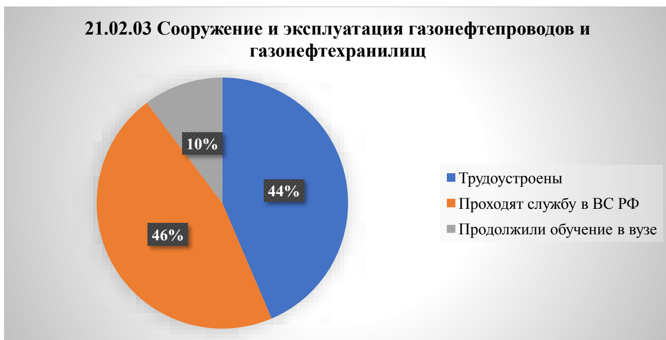
Рисунок 3 – Показатели дальнейшей деятельности выпускников 2022-2023 уч. г. специальности 21.02.03

Среди выпускников специальности 18.02.09 Переработка нефти и газа 38% человек трудоустроены.